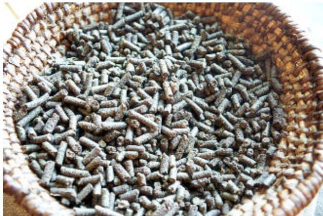
Pellets: aus heimischem Holz gepresster, nachwachsender Brennstoff

Das auch im NUP verankerte Prinzip der Nachhaltigkeit muss durch ein Konzept des „sustainable development“ verfolgt werden, womit eine ressourcenschonende, dauerhaft umweltgerechte, wirtschaftlich und sozial verträgliche Entwicklung anzustreben ist. Die dafür erforderlichen zentralen Forderungen lauten: