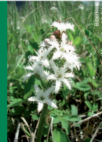
Bitterklee ( Menyanthes trifoliata )