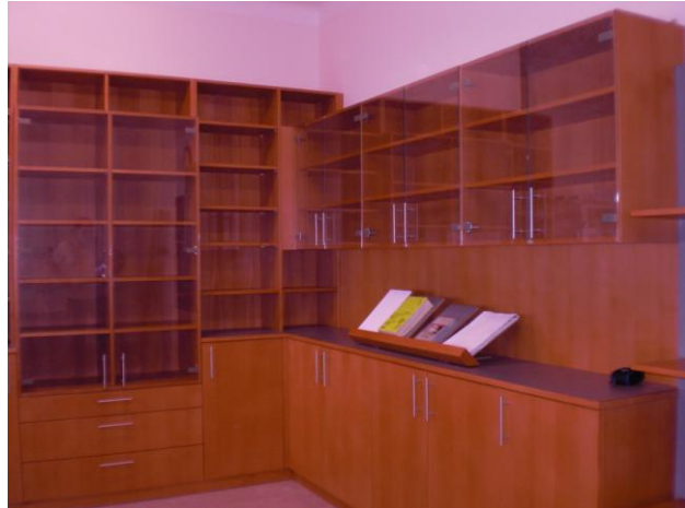
Projekt „Bibliothek – LBS Mureck“

in Gleisdorf, sowie die Innenausstattung für ein Lehrerkabinett in der Landesberufsschule Fürstenfeld angefertigt. Die Lehrlinge im neuen Lehrberuf „Tischlereitechnik – Planungs- bzw. Produktionstechnik“ haben bei diesen Projekten wertvolle Erfahrungen sammeln können.