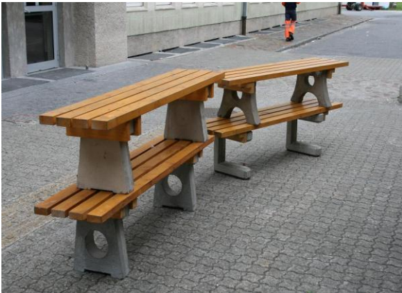
Bänke für den Schulhof

Balkongeländer im Lehrlingshaus auf das gesetzlich vorgeschriebene Maß erhöht und Bänke für den Schulhof hergestellt. Bei der Leonhardi-Kirche wurden vom Hausschwamm befallene Fußbodenteile erneuert.