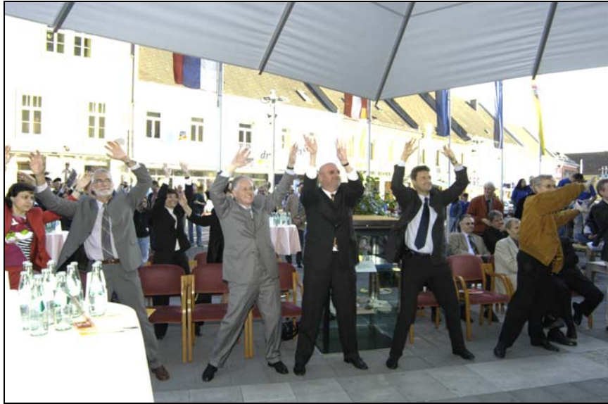
Eröffnung der Bundessommerspiele