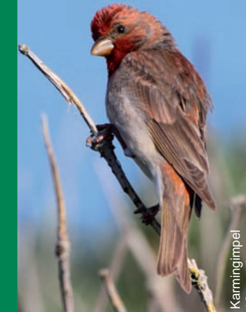
Karmirgimpel ( Carpodacus erythrinus )