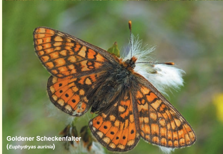
Goldener Schreckenfaller ( Euphydryas aurinia )