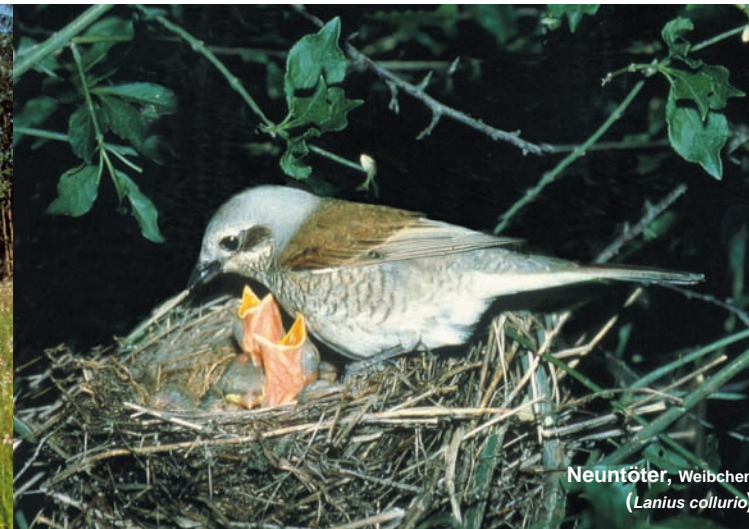
Neuntöter, Weibchen ( Lanius collurio )

Das Wörschacher Moos ist das größte Feuchtgebiet des steirischen Ennstales mit 178 ha Moorfläche. Der Wasserhaushalt des größtenteils abgetorften Moores wurde aber durch zahlreiche Entwässerungsgräben verändert. Dadurch kam es zur stetigen Bewaldung der Moorflächen. In den Randbereichen befindet sich aber noch ein vielfältiges Biotopmosaik mit ungestörten und regenerierenden Hochmoorschlenken und -bulten, Übergangsmoorbereichen, Niedermoorgebieten, anmoorigen Wiesen wie Pfeifengras-, Kleinseggen- und Irisstreuwiesen, Röhrichten, Au- und Bruchwäldern sowie stehenden und fließenden Gewässern. Seit 1982 ist das Wörschacher Moos Naturschutzgebiet und 2006 wurde es als Europaschutzgebiet verordnet. Das Wörschacher Moos und die ennsnahen Bereiche stellen einen wichtigen inneralpinen Brutplatz für Wasservogel und Wiesenbrüter dar. Bemerkenswert ist auch die Vielzahl an Durchzüglern , die dieses Gebiet auf ihrem Weg in Richtung Süden als Rastplatz nutzen.