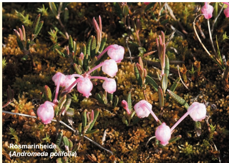
Rosmarinheide ( Andromeda polifolia )