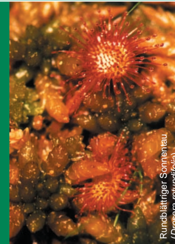
Rundblättriger Sonnentau ( Drosera rotundifolia )