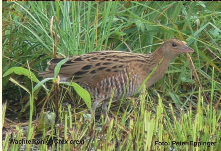
Wachtelkönig ( Crex crex )