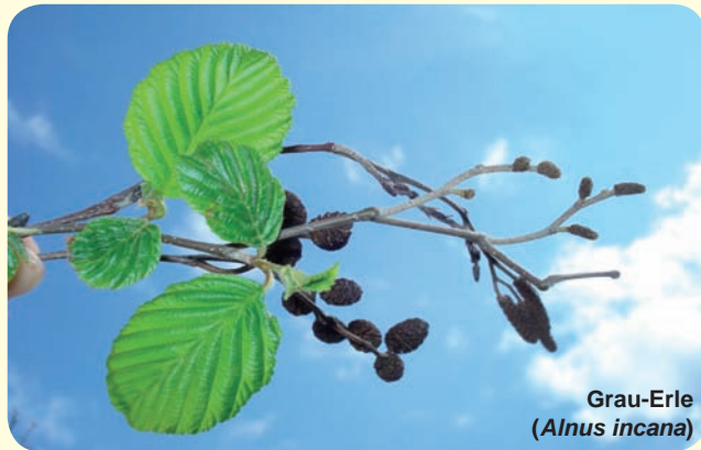
Grau-Erle ( Alnus incana )

Die Grau-Erle ( Alnus incana ), die besonders in der Obersteiermark oft dominant in Galerie- und Auwäldern vorkommt, kann dort eine Wuchshöhe von 15 m erreichen. Durch Symbiose mit dem Bakterium Frankia alni kann sie Stickstoff aus der Luft binden. Durch Anreicherung von Stickstoffverbindungen kommt es zu einer Verbesserung des Bodens.