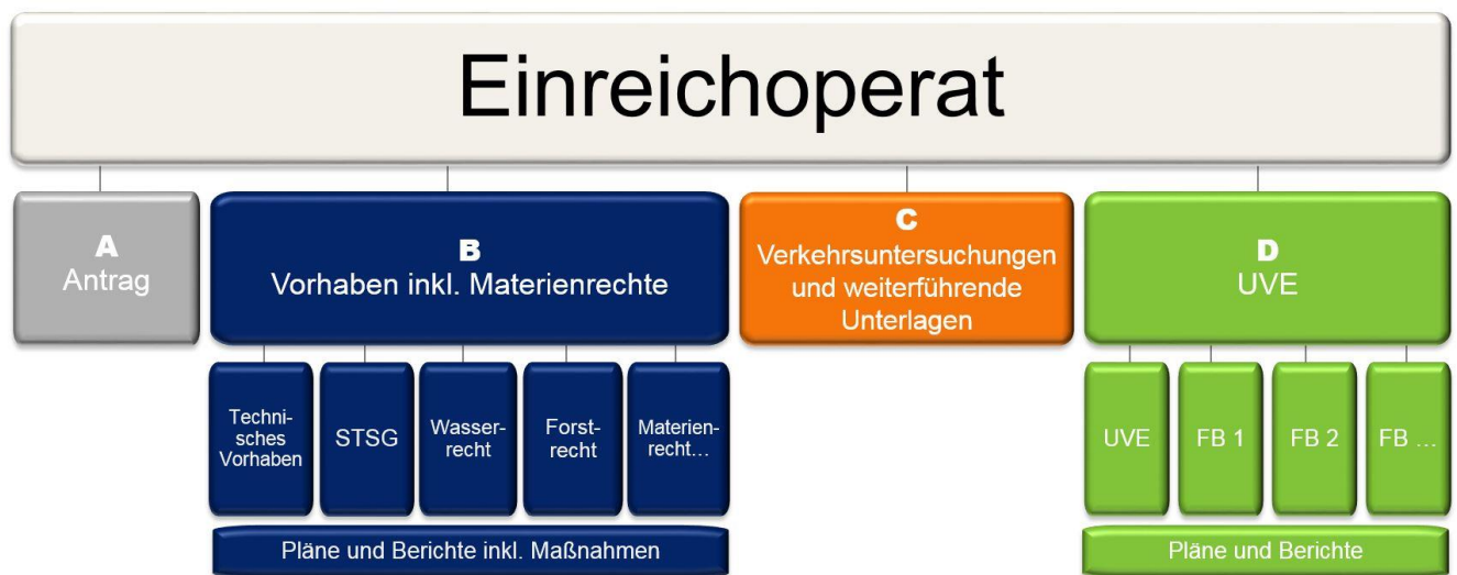
Abbildung 3: Übersicht über die Unterlagen (Einreichoperat) für das Trassenfestlegungsverfahren mit UVP-Verfahren

Die Unterlagen (Einreichoperat) für das Trassenfestlegungsverfahren gemäß § 4 BStG mit UVP setzen sich aus dem Antrag, dem Vorhaben inklusive Materienrechte, den Verkehrsuntersuchungen und weiterführenden Unterlagen und der UVE zusammen (sh. Abb. 3). Das straßenbauliche Einreichprojekt bildet die Grundlage für das technische Vorhaben.