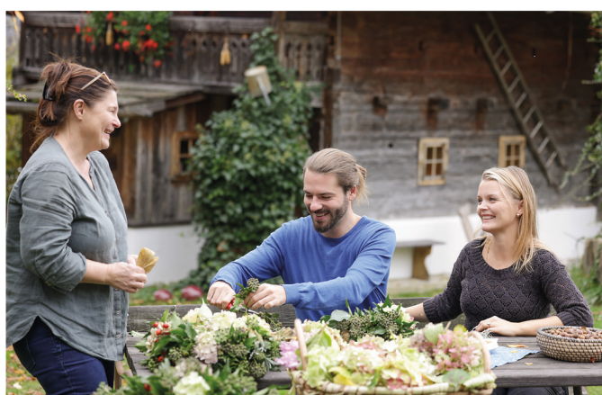
Junge Familien wurden zum Probewohnen in die Oststeiermark eingeladen

Das Projekt „Lebensregion Oststeiermark“ ist in der Region entstanden. Die Regionalentwicklung in der Steiermark setzt auf viele weitere regional gewachsene Projekte und Zusammenarbeit vor Ort. Dadurch entstehen starke Regionen für die Herausforderungen der Zukunft.