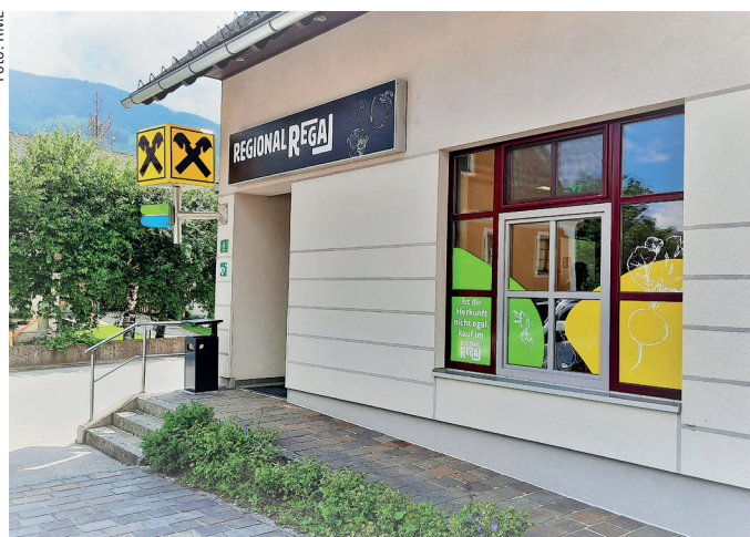
Der regionale Selbstbedienungsladen in Ardning.