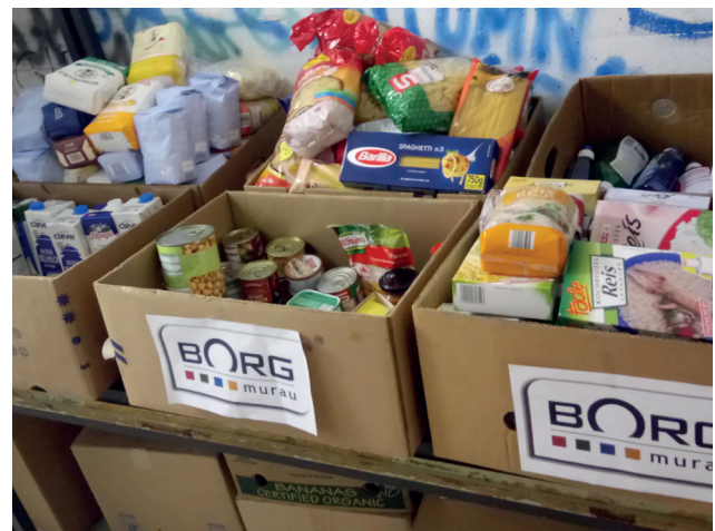
Lebensmittelspenden helfen weiter. Schülerinnen des BORG Murau haben Lebensmittel gesammelt und an das Team Österreich übergeben