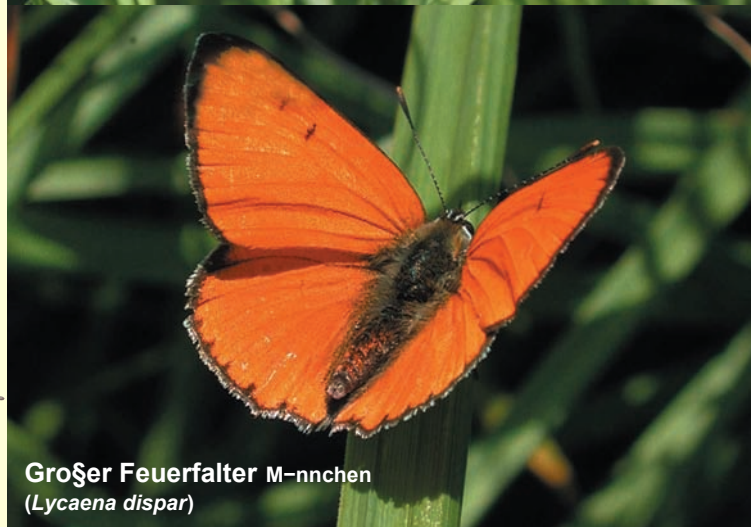
Großer Feuerfalter Männchen ( Lycaena dispar )