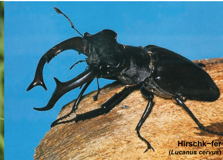
Hirschkäfer ( Lucanus cervus )