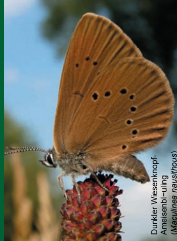
Dunkler Wiesenknopf-Ameisenbläuling (Maculinea nausithous)