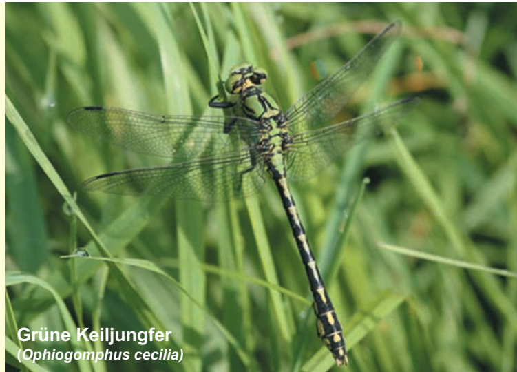
Grüne Keiljungfer ( Ophiogomphus cecilia )

man an der Unterseite deutlich gelbe Flecken erkennen. Bei Gefahr wirft sich die Unke auf den Rücken - in Ähnstellung - und signalisiert dem Angreifer Giftigkeit. Als Lebensraum werden von der Gelbbauchunke seichte, gut besonnte, lehmige Pfützen oder Kleintümpel genutzt.