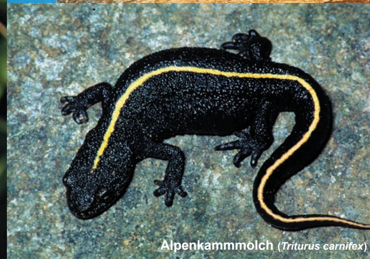
Alpenkammmolch ( Triturus carnifex )