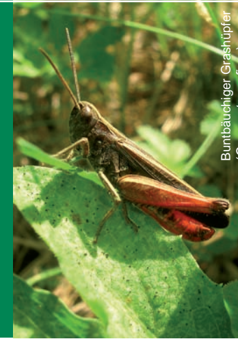
Buntbäuchiger Grashüpfer ( Omocestus rufipes )