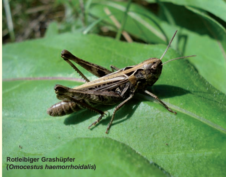
Rotleibiger Grashüpfer ( Omocestus haemorrhoidalis )