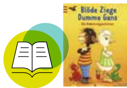
„Blöde Ziege, dumme Gans!“ Isabel Abedi, ArsEdition

Wechsel der Perspektive: Ziege und Gans streiten und versöhnen sich: Sie sind die Vorbilder, wenn es um das Lösen von Konflikten geht. Denn beide kommen zu Wort.