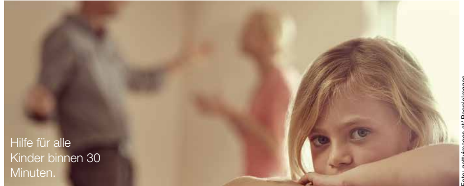
Hilfe für alle Kinder binnen 30 Minuten.

„Es gibt auch in der Steiermark Kinder und Jugendliche, die Hilfe, Unterstützung und manchmal auch Schutz brauchen“, so Soziallandesrätin Kam-