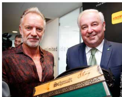
Schützenhöfer überreichte Sting eine steirische Harmonika.

Gordon Matthew Thomas Sumner, besser bekannt unter seinem Künstlernamen Sting, wurde im Vorfeld seines Auftritts am Grazer Messegelände vom steirischen Landeshauptmann Hermann Schützenhöfer gemeinsam mit Kulturlandesrat Christopher Drexler und dem Grazer Bürgermeister Siegfried Nagl herzlich in der Steiermark willkommen geheißen. Der ehemalige „Police“-Frontman, der ja Anfang Juli schon die beiden Tage vor seinem Konzert in Graz in der Steiermark verbracht hatte, konnte sich anlässlich seines Besuches bereits von der