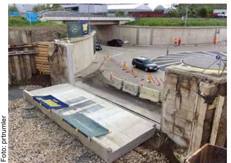
Im Mai fiel in Weiz die Mauer beim Interspar-Kreis.