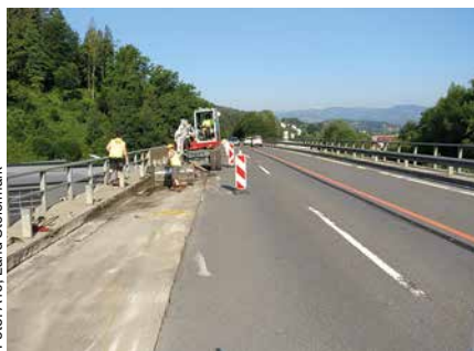
Die Sanierung der Kainachbrücke in Voitsberg wurde bereits begonnen.