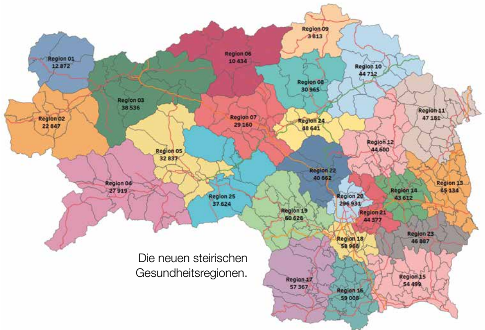
Die neuen steirischen Gesundheitsregionen.

Mit dem Gesundheitstelefon 1450 und einem neuen Bereitschaftsmodell für Ärzte startete mit 1. April 2019 eine neue Ära der Gesundheitsversorgung. Seitdem gab es über das Telefon 23.430 Anrufe und daraus ergaben sich 3890 Visiten. „Wir haben in den ersten Wochen gesehen, dass das neue Modell, das grundsätzlich auf dem System des Visitedienstes beruht, mit Anlaufschwierigkeiten zu kämpfen hatte. Die Entwicklung zeigt aber in eine positive Richtung. Zudem haben wir uns nun auf Optimierungen des Bereitschaftsdienstmodells geeinigt“, betonte Gesundheitslandesrat Christopher Drexler, der gemeinsam mit