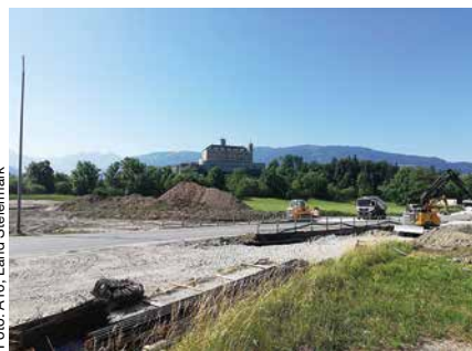
Schloss Trautenfels: Bis 08/2021 haben die Baumaschinen das Sagen.