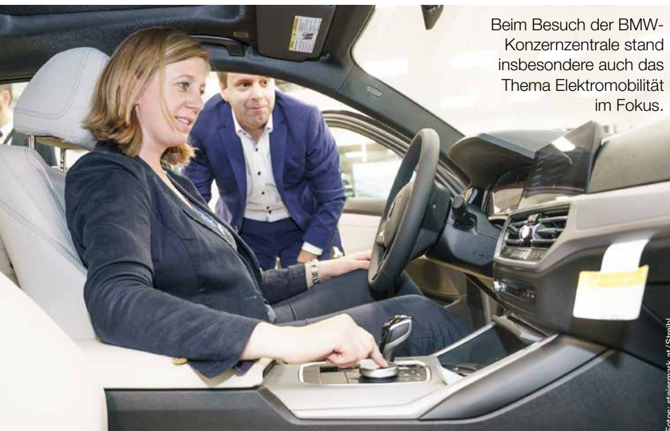
Beim Besuch der BMW-Konzernzentrale stand insbesondere auch das Thema Elektromobilität im Fokus.