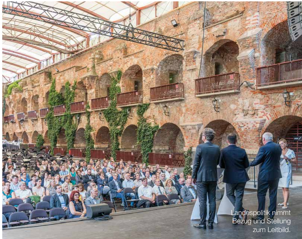
Landespolitik nimmt Bezug und Stellung zum Leitbild.