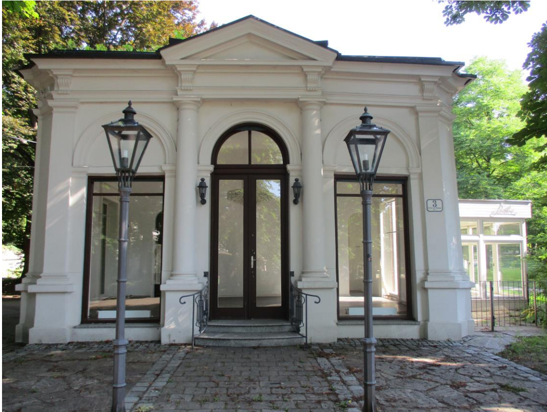
Bekannt als Blumenpavillon