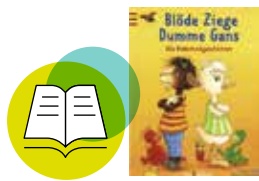
„Blöde Ziege, dumme Gans!“ Isabel Abedi, ArsEdition

Wechsel der Perspektive: Ziege und Gans streiten und versöhnen sich: Sie sind die Vorbilder, wenn es um das Lösen von Konflikten geht. Denn beide kommen zu Wort.