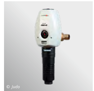
3 Beispiele moderner Hausinstallationstechnik, wo rückspülbarer Filter und Druckminderer kombiniert sind.